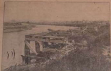
EEN GEZICHT OP DE VOORMALIGE SAKEN TE NIEUWPOORT