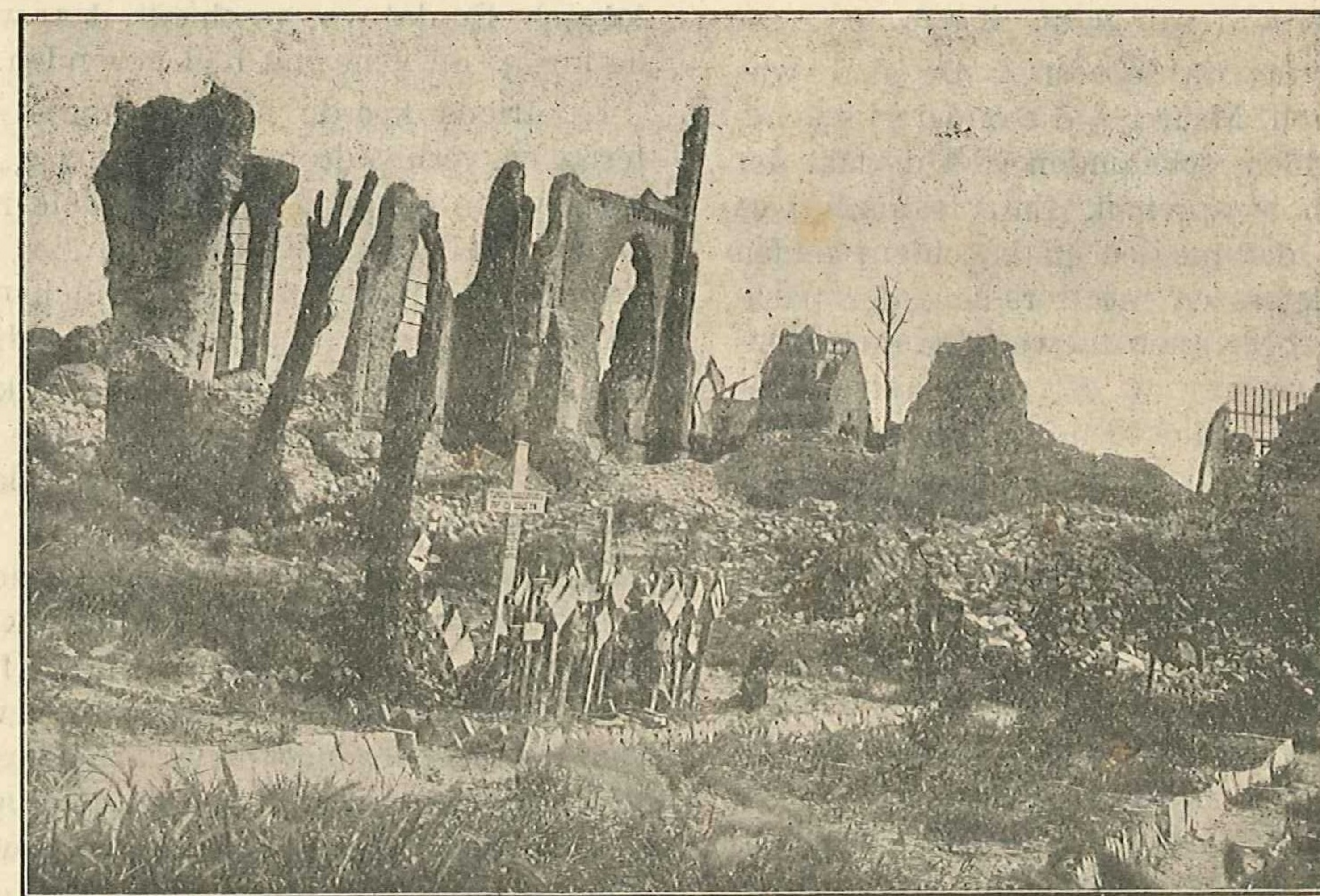
De vernielde kerk van Nieuwpoort met graven

Schoon land! Maar arm... Och Heere, zoo arm! Niet in geld, niet in vruchtbaarheid van den bodem... Elk jaar zwol er de grond van weelde en rijkdom. Bedelaars zag men er niet, tenzij in die oude, uitgestorven straten en steegen van Ieperen, waar vrouwtjes in versleten kapmantels de centen telden en